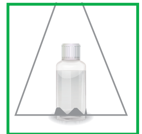
3. Runde Öffnung der Klebefalle bis zum Flaschenboden herunterschieben

Essig (Lebensmittelqualität enthält maximal 10% Essigsäure)